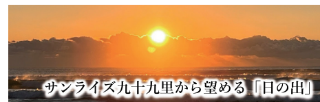
サンライズ九十九里から望める「日の出」