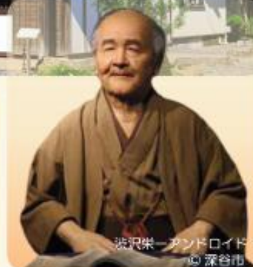
渋沢栄一アンドロイド 心 深谷市

渋沢翁ゆかりの地を巡りつつ、生涯に約500の会社設立に携わった「 渋沢翁の精神 」を学ぶモニターツアーに御参加いただき、研修の企画・立案にお役立てください。