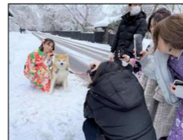
インフルエンサー招請の例