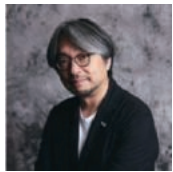
小山 薫堂 放送作家 京都芸術大学副学長