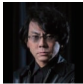
石黒 浩 大阪大学教授 ATR石黒浩特別研究所客員所長