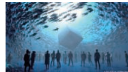
© 2022 WOW inc. All Rights Reserved

デジタルヒューマンという新しい身体の写し鏡、 変形構造体建築による新しい風景の鏡、デジタルと フィジカル二つの鏡を通じて磨き輝く命の形を示す