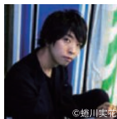
落合 陽一 メディアアーティスト