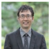
福岡 伸一 生物学者 青山学院大学教授