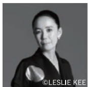
河瀬 直美 映画作家