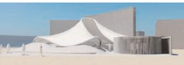
© Dynamic equilibrium of Life / EXPO2025