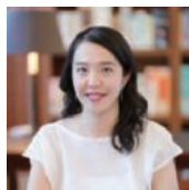
中島 さち子 音楽家、数学研究者 STEAM教育家