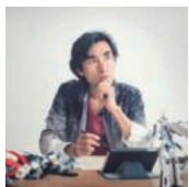
河森 正治 アニメーション監督 メカニックデザイナー